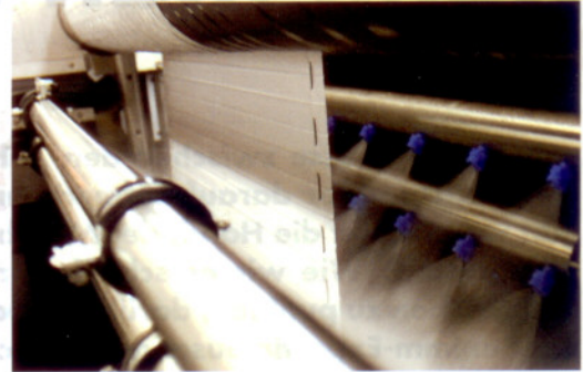
Selbst Plisseevorhänge werden formstabil und knickfrei gereinigt