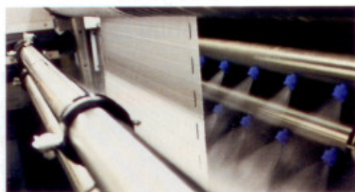
Plisseevorhänge werden formstabil und knickfrei gereinigt.

Info: Mehr zum Thema „Professionelle Reinigung von Sonnenschutz“ sowie VDS-Fachbetriebe unter www.vds-sonnenschutz.de